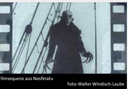
Filmsequenz aus Nosferatu

Neuertonung des Stummfilmklassikers von Friedrich Wilhelm Murnau aus dem Jahr 1922 durch Walter Windisch-Laube Ulrike Schimpf (Saxofon und Klarinette) Walter Windisch-Laube (Klavier) Ort: Marktplatzbühne Alsfeld Veranstalter: Alsfelder Kulturtage e.V. Eintritt frei - Spenden gerne