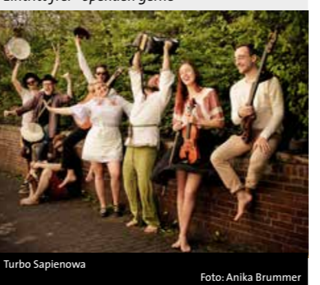
Turbo Sapienowa

Turbo Sapienowa präsentieren mit Spaß und Herzblut einen durchgepeitschten Mix aus Coversongs und Vollgas-Eigenkompositionen Ort: Marktplatzbühne, Alsfeld Veranstalter: Alsfelder Kulturtage e.V. Eintritt frei - Spenden gerne