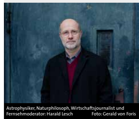
Astrophysiker, Naturphilosoph, Wirtschaftsjournalist und Fernsehmoderator: Harald Lesch

Vortrag von Prof. Dr. Harald Lesch Ort: Stadthalle, Alsfeld, Jahnstraße 14 Veranstalter: Alsfelder Kulturtage e.V. in Kooperation mit Alsfelder Weltladen e.V. und dem Klimafairein Oberhessen e.V. Eintritt: 10 Euro, ermäßigt 7 Euro Vorverkauf im Buchladen Lesenswert