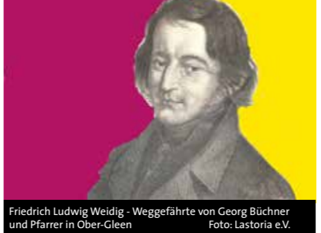
Friedrich Ludwig Weidig - Weggefährtin von Georg Büchner und Pfarrer in Ober-Gleen