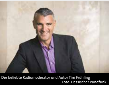
Der beliebte Radiomoderator und Autor Tim Frühling

HESSENTAGSTOD Tim Frühling liest aus seinem Kriminalroman zum Hestentag Ort: hôtel villa raab, Alsfeld, Altenburger Straße 60 Veranstalter: Alsfelder Kulturtage e.V. Eintritt: 10 Euro Vorverkauf im Buchladen Lesenswert