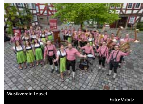
Musikverein Leusel

FRÜHSCHOPPEN MIT BLASMUSIK Moderne Blasmusik, Schlager und Pop sowie jede Menge Spaß und gute Laune mit dem Musikverein Leusel Ort: Bürgergarten, Alsfeld, Volkmarstraße Veranstalter: Alsfelder Kulturtage e.V. Eintritt frei - Spenden gerne