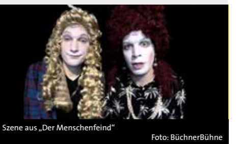
Szene aus „Der Menschenfeind“

Jean-Baptiste Poquelin alias Molière (geb. 1622) schuf die Komödie, die vom Ensemble der Bühnenbühne Riedstadt nach einer Inszenierung von Christian Suhr aufgeführt wird. Ort: Stadthalle Alsfeld, Jahnstraße Veranstalter: Alsfelder Kulturtage e.V. Vorverkauf: 18 Euro zzgl. Gebühr, www.reservix.de und Buchladen Lesenswert Abendkasse: 20 Euro