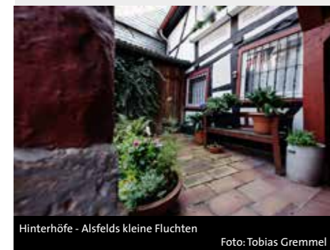
Hinterhöfe - Alsfelds kleine Fluchten

Fotografische Einblicke in verborgene Ecken von Tobias Gremmel mit Texten von Traudi Schlitt Musik: Schwenk&Litzka Ort: Museumsscheune, Alsfeld, Rittergasse 3 Veranstalter: Alsfelder Kulturtage e.V. Eintritt frei - Spenden gerne