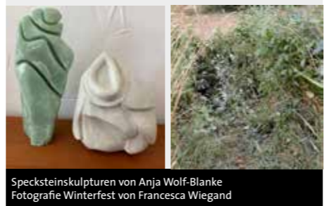
Specksteinskulpturen von Anja Wolf-Blanke Fotografie Winterfest von Francesca Wiegand

BLICKPUNKT NATUR Faszination Speckstein, Skulpturen von Anja Wolf-Blanke, und Fotografien aus der Serie Winterfest von Francesca Wiegand Musik: Sascha und Tanja Reif (Gitarre und Saxofon) Ort: Haus Schnitzer, Alsfeld, Mainzer Gasse 15 Veranstalter: Alsfelder Kulturtage e.V. Eintritt frei - Spenden gerne