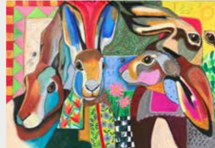
Hasen - MixedMedia auf Papier Pia Rüssel, Alsfelder Kunstverein e.V. © Pia Rüssel

Öffnungszeiten: täglich von 15 - 18 Uhr Dauer: 13.5. bis 29.5.2022